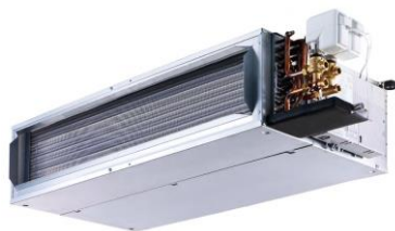
ΚΡΥΦΟΥ ΤΥΠΟΥ ΨΕΥΔΟΡΟΦΗΣ ΜΕΣΑΙΑΣ ΣΤΑΤΙΚΗΣ ΠΙΕΣΗΣ

** Θερμοκρασία νερού 50°C / 60°C / 70°C - Μέγιστη ταχύτητα ανεμιστήρα