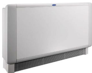
ΔΑΠΕΔΟΥ/ΟΡΟΦΗΣ ΕΜΦΑΝΕΣ ΜΕ ΚΑΛΥΜΜΑ ΚΑΙ ΧΕΙΡΙΣΤΗΡΙΟ