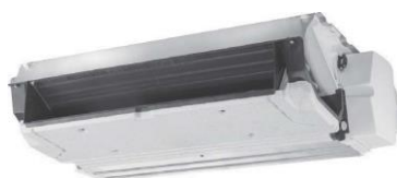
ΚΡΥΦΟΥ ΤΥΠΟΥ ΔΑΠΕΔΟΥ/ΨΕΥΔΟΡΟΦΗΣ

** Θερμοκρασία νερού 50°C - Μέγιστη ταχύτητα ανεμιστήρα