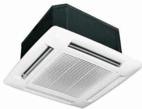
ΚΑΣΕΤΑ ΨΕΥΔΟΡΟΦΗΣ 4 ΚΑΤΕΥΘΥΝΣΕΩΝ